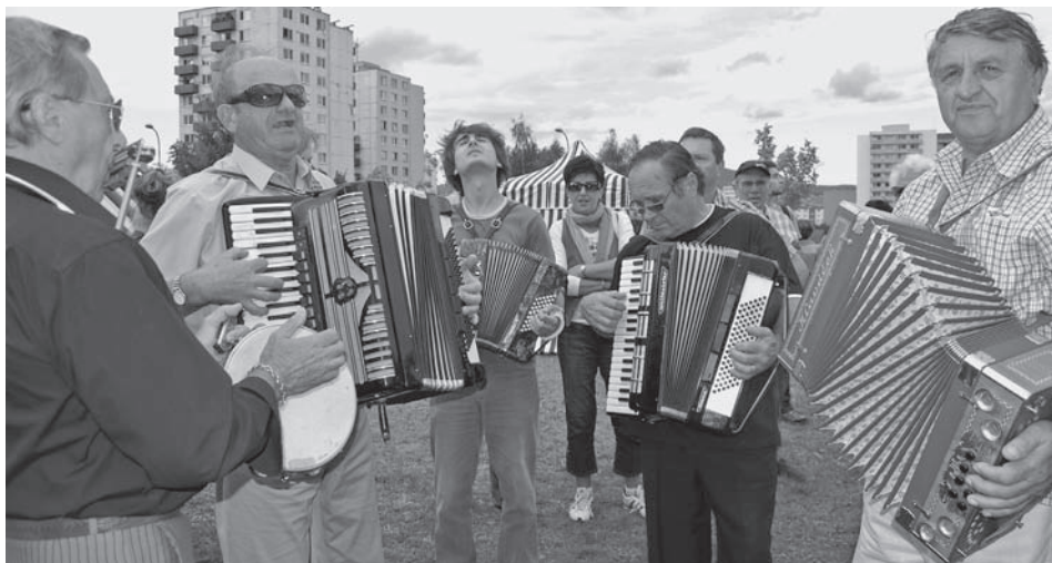
Vlani sa na jarmoku stretli heligonkári, tohto roku sa bude súťažiť o najkrajší klobúk.