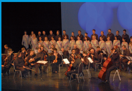
Spevácky zbor Lučnica priniesol hudobný zážitok divákovi na záverečnom koncerte medzinárodného festivalu sakrálnej hudby Musica sacra.